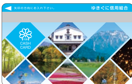
キャッシュカード