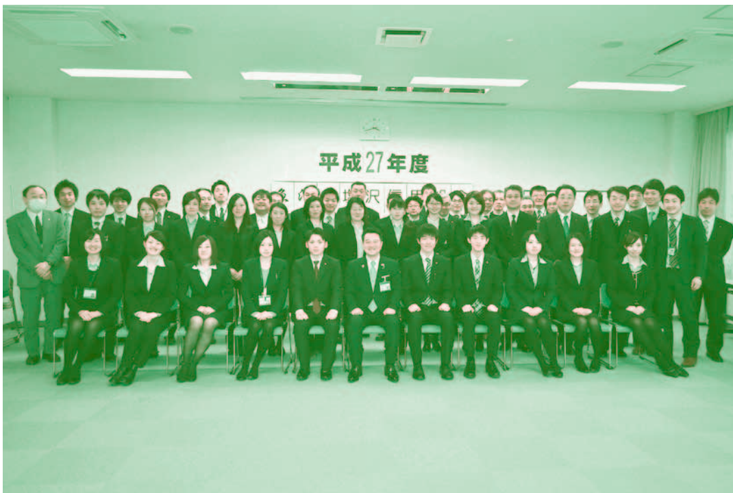
平成27年度 職員大会