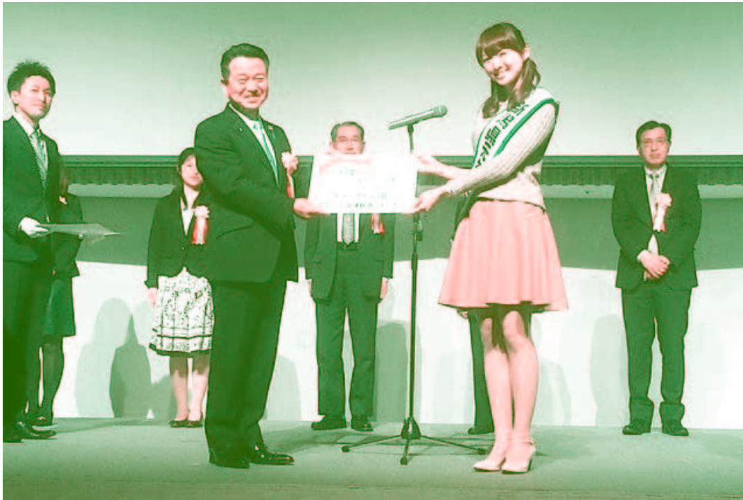
元気にいがた健康アワード