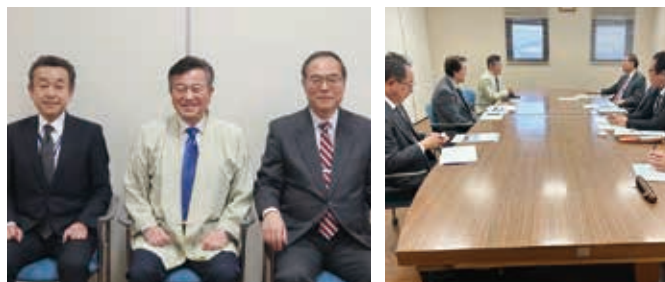
右：財務省 関東財務局長 成田 耕二様 左：財務省関東財務局 新潟財務事務所長 石田 茂様

トップヒアリング（成田関東財務局長来訪） トップヒアリングを当組合本店会議室で実施していただきました。トップヒアリングでは成田関東財務局長からご来訪いただき、当組合の取組みについて詳しくご説明させていただきました。